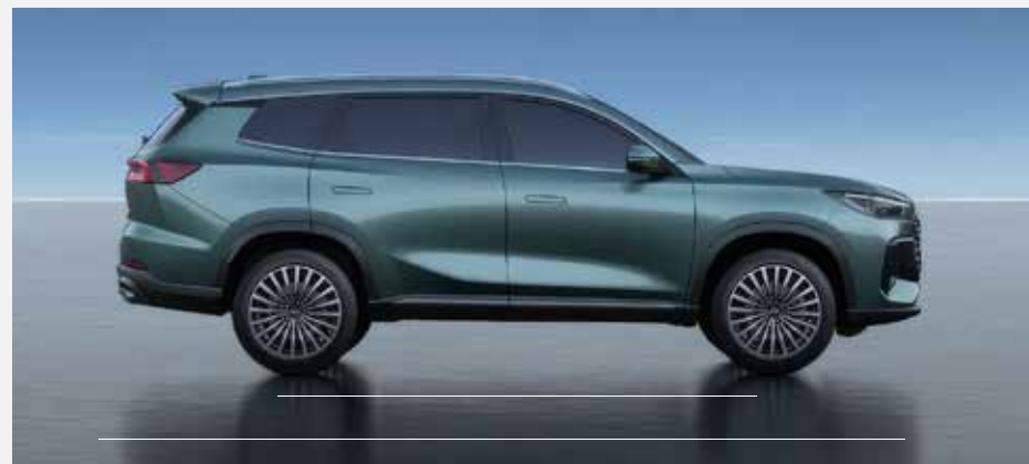
Celková dĺžka: 4 725 mm, rázvor náprav: 2 710 mm