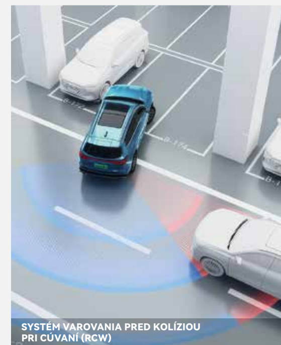
SYSTÉM VAROVANIA PRED KOLÍZIOU PRI CÚVANÍ (RCW)

ADAS systémy sú súčasťou stratégie značky v oblasti bezpečnosti a moderných technológií. CHERY, ako výrobca, ktorý vyvíja vlastné riešenia v oblasti autonómie a umelej inteligencie, ponúka čoraz pokročilejšie asistenčné systémy vodiča.