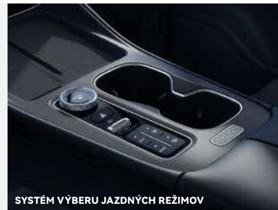
SYSTÉM VÝBERU JAZDNÝCH REŽIMOV

Pod kapotou TIGGO 8 pracuje moderný štvorvalcový motor 1.6 Turbo T-GDI (Turbo Gasoline Direct Injection), vyvinutý na základe globálnej technológie ACTECO. Ide o motor, ktorý spája vysoký výkon s úspornosťou. Dvojspojková automatická prevodovka 7DCT (Getrag) bola navrhnutá pre tých, ktorí oceňujú pohodlie automatu, ale nechcú sa vzdať dynamiky športového charakteru.