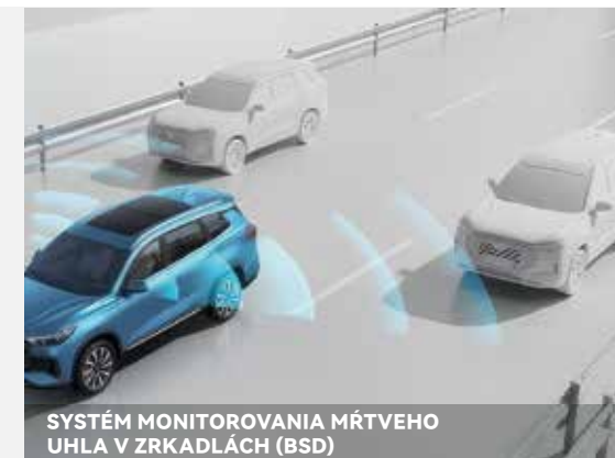
SYSTÉM MONITOROVANIA MŔTVEHO UHLA V ZRKADLÁCH (BSD)