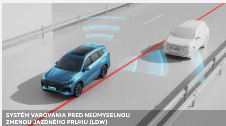
SYSTÉM VAROVANIA PRED NEÚMYSELNOU ZMENOU JAZDNÉHO PRUHU (LDW)