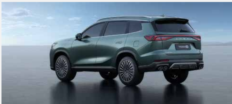
Maximálny objem batožinového priestoru: 1 930 l (so sklopenými sedadlami v 2. a 3. rade)