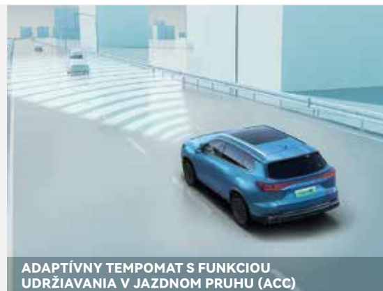
ADAPTÍVNY TEMPOMAT S FUNKCIOU UDRŽIAVANIA V JAZDNOM PRUHU (ACC)