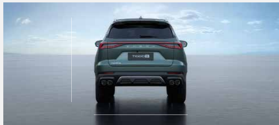
Celková šírka vrátane zrkadiel: 1 860 mm, celková výška: 1 705 mm