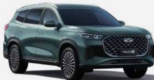
BAMBOO GRAY (UM)