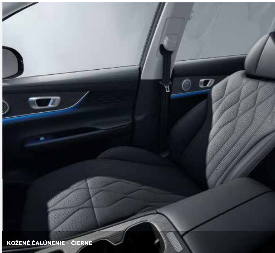
KOŽENÉ ČALÚNENIE – ČIERNE