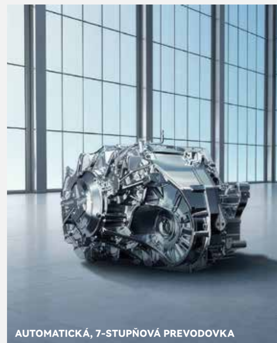
AUTOMATICKÁ, 7-STUPŇOVÁ PREVODOVKA