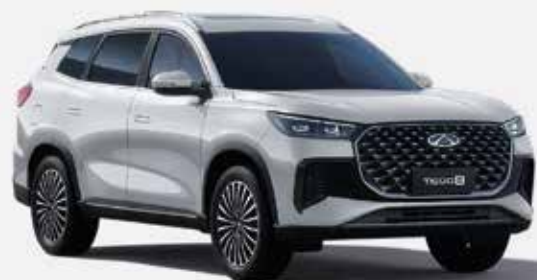
KHAKI WHITE (BW)