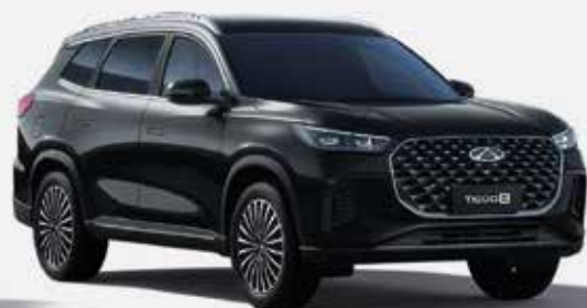
CARBON CRYSTAL BLACK (CL)