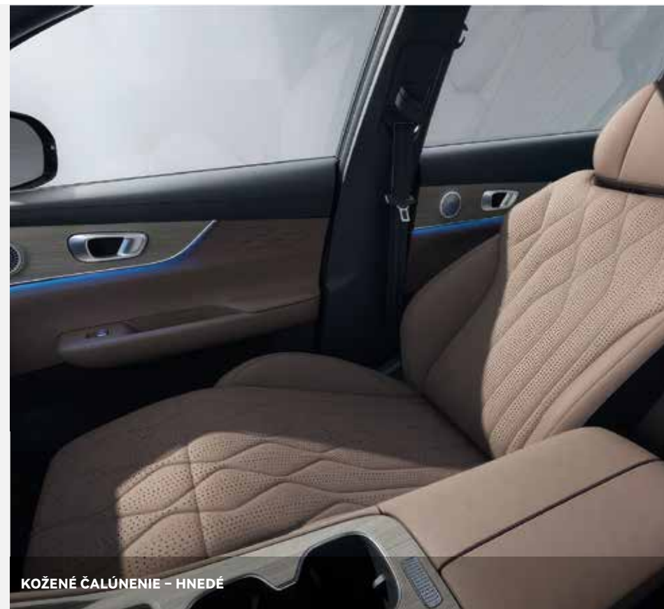
KOŽENÉ ČALÚNENIE – HNEDÉ