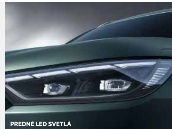
PREDNÉ LED SVETLÁ