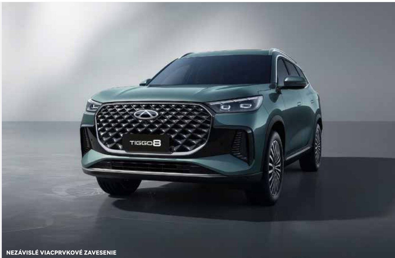
NEZÁVISLÉ VIACPRVKOVÉ ZAVESENIE