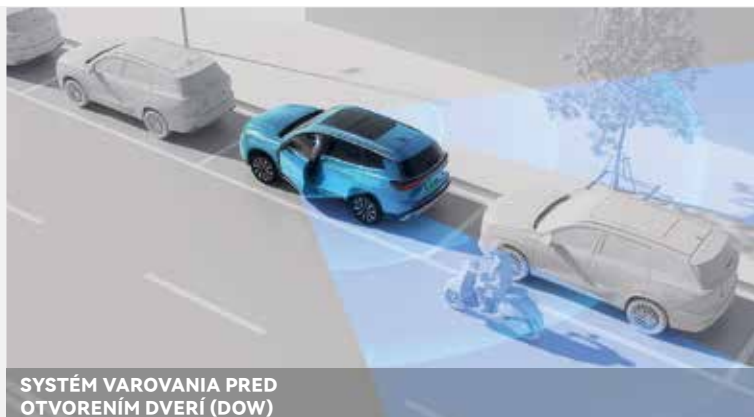
SYSTÉM VAROVANIA PRED OTVORENÍM DVERÍ (DOW)