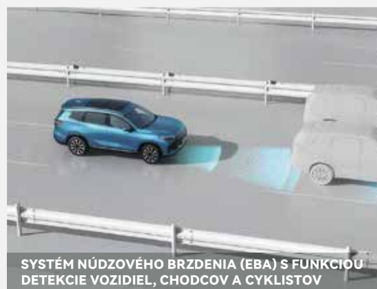
SYSTÉM NÚDZOVÉHO BRZDENIA (EBA) S FUNKCIOU DETEKcie VOZIDIEL, CHODCOV A CYKLISTOV