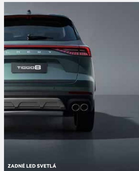
ZADNÉ LED SVETLÁ