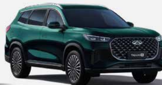
AURORA GREEN (SJ)